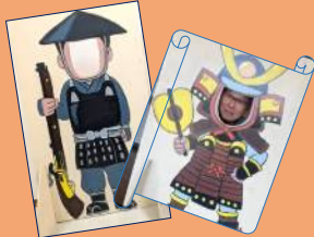
【体験ブースに顔抜パネルも設置】

火縄銃と名張の縁は深く、名張は全国で唯一「青竹による 火縄」作りが行われています(三重県指定伝統工芸品)