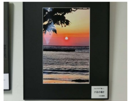
1階通路：写真展示エリア 担当：フォトクラブ「集い」