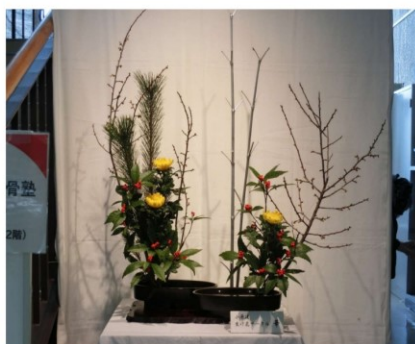
階段脇：生花コーナー(1月作品) 担当：生け花サークル「華」