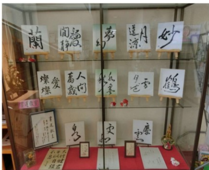
展示ケース：1月 担当：書道教室

今回は展示ケース、階段脇生け花コーナー、1階通路の写真展示エリアの作品を紹介します。