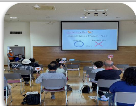
おさらい〇×クイズ講義風景