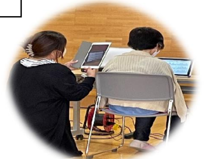
物忘れチェックタッチパネル 実演 (6月30日開催)