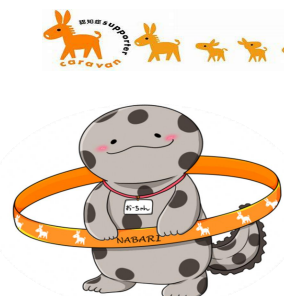
名張市 地域包括支援センター 応援マスコット・おーちゃん