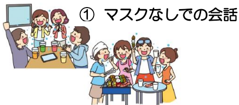
① マスクなしでの会話