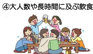
④ 大人数や長時間に及ぶ飲食