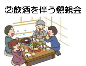
② 飲酒を伴う懇親会