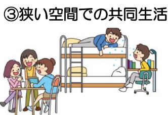
③ 狭い空間での共同生活