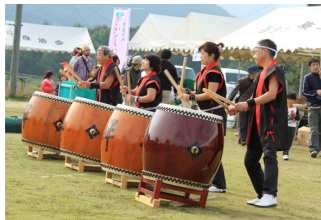
「2013地域フェスタ」に出演、演奏する絆

こんにちは サークル「和太鼓 絆」です。腹にしみる和太鼓の響き、日本伝統の音色。こどもさんから高齢者まで、一緒に演奏できます。月2回の練習で、「地域夏祭り」や「地域フェスタ」他の出演の機会があり、演奏をしています。健康維持やダイエット効果もあります。あなたも一緒に練習しませんか。