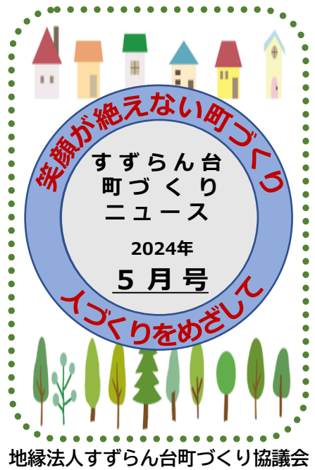
地縁法人すずらん台町づくり協議会

風薫る若葉の季節となりました。住民の皆様にはお元気にお過ごしのことと思います。今年1月1日に能登半島を襲った巨大地震で、いままなおインフラ面の復旧してない地域があり大きな災害の爪痕を残しています。前年度地域の皆様から寄せていただいた震災義援金は、名張社会福祉協議会を通して赤十字に届けました。地震や風水害も今までと違って規模が大きくなっています。今後、対岸の火事とせず町づくり協議会も防災と安心安全な町づくりを進めることが大事になってきています。 すずらん台地域の子どもから高齢者まで集える市民センター、きずな、お茶屋、集会所で皆が、元気で明るくすごせる居場所づくりの充実に取り組みます。そして、各ボランティア活動の皆さんと共同して支えあう地域になるよう努めます。 今年の町づくり協議会は、夏祭り(花火大会)、センター祭り、すずらんフェスタなど、各種行事で地域のコミュニケーションがはかれるよう開催します。皆様のご支援・ご協力をよろしくお願いたします。