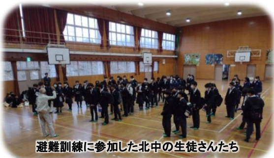
避難訓練に参加した北中の生徒さんたち

さて、近年の災害で民生委員が巻き込まれるケースが増えています。全国民生委員児童委員連合会発行の「災害に備える民生児童委員活動ハンドブック」を参考に、災害時の民生委員の活動を学び、日頃から何時やってくるか分からない災害への意識と備えを怠らないように、地域組織とも連携していきたいと思います。