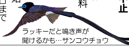
ラッキーだと鳴き声が聞けるかも…サンコウチョウ