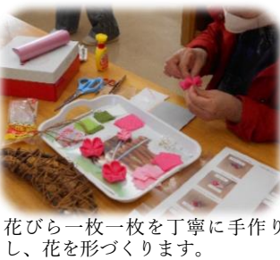
花びら一枚一枚を丁寧に手作りし、花を形づくります。

50枚も花びらを作るのはたいへんでしたが、繰り返し作るうちに手馴れてきて、どんどん花びらが机に並んでいきました。ひとつ花が完成する度に達成感もあり、皆さん頑張りました! 2回目はつぼみと蝶と葉っぱの制作です。花びらの折り方を少しアレンジして作ります。製作したモチーフをバランスよく土台に配置して接着し、濃淡の桜が可愛らしい素敵なりースが完成しました! 気持ちもパツと明るくなるようなこの作品を皆様にもご覧いただき