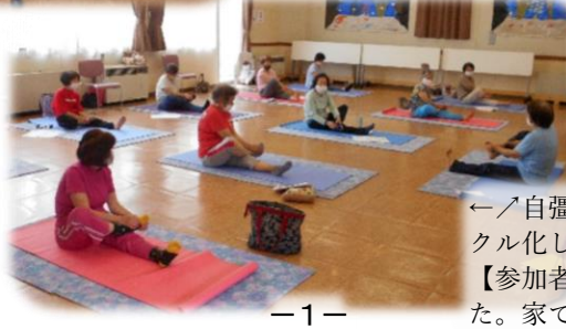
←自彊術体験講座…3回の講座を終了後、サークル化し「自彊術すずらん」として活動中です。 【参加者のご意見】・体に良さそう・体が軽くなった。家で毎日少しずつでもやってみたい、等など

→音楽工房さんと歌いましょう♪:恒例の歌の会です。マスク着用で距離と取り、お口の体操や、歌を楽しみました。