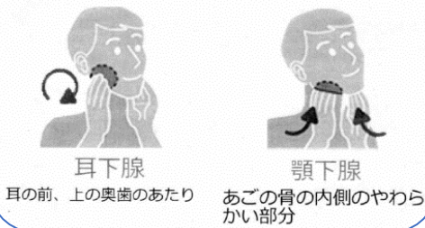
耳下腺 耳の前、上の奥歯のあたり