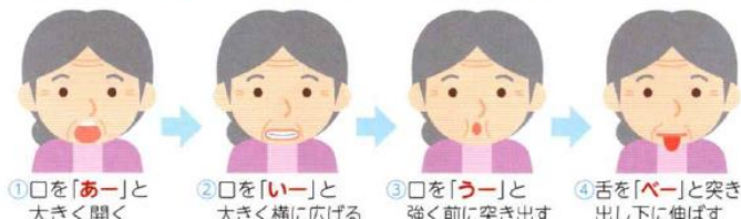
①口を「あー」と大きく開く