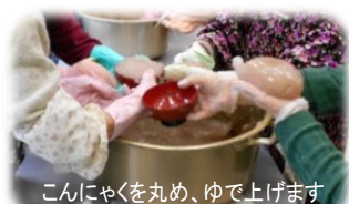
こんにやくを丸め、ゆで上げます

名張ユネスコ協会より 書きそんじはがき、年賀状を集めています!ご協力お願いします!!