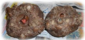
立派なこんにやく芋をみんなで皮むき