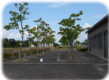
きれいになった市民センターと教育会館みなくるの間の遊歩道

お知らせします。お楽しみに！ 上映作品はセンターだより8月号で 映画上映会を行います。 8月30日(金)10:00～ 予告