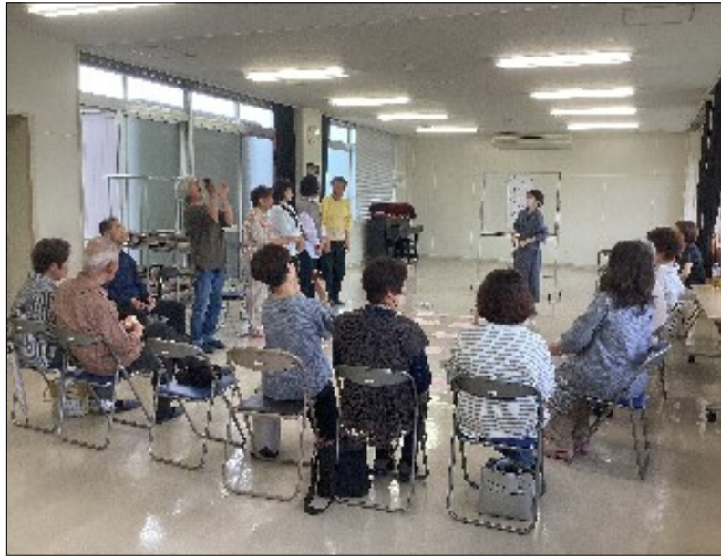
笑いの絶えないチーム別すごろくゲーム

も「OK!」です。赤坂集会所 七月十日十四時「市民みんなが救急救命士」 ◆中村公民館 七月十六日十三時半「警察防犯教室」 ◆瀬古口公民館 七月十九日 十三時半「eスポーツ」 ◆夏見公民館 七月二十二日 十三時半～十五時「市民みんなが救急救命士」