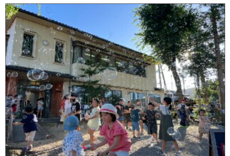
境内を舞い上がるシャボン玉

歓声があがりました。仕上げはじゃんけんゲームや大ビンゴ大会で商品ゲット。終始黄色い声が響き渡っていました。神様や地域の方々はどう思われたのでしょうか。来年の夏祭りをもっと賑やかに楽しい企画になっていくでしょう。