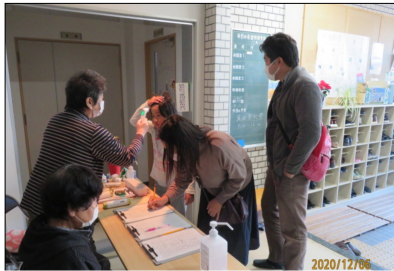
昨年度文化祭感染対策の様子

令和二年度の事業はコロナ禍により、中止や縮小を余儀なくされました。新しい生活様式を守り、