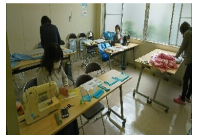
昨年度のマスク作りの様子

のみなさんに参加をいただき、止めることなく進めていかなければなりません。令和三年度の事業も、新型コロナウイルス