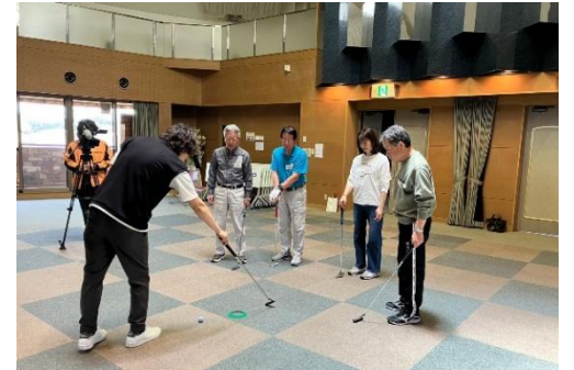
▲パターの方向性を学ぶ参加者

今回の講座は初めての方はゴルフの楽しさを体験して頂き、経験者の方には更なるレベル向上につながればと思っております。