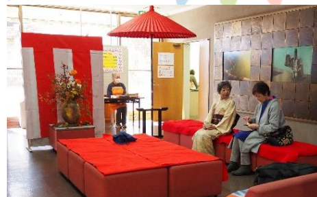
▲華やかな雰囲気のお茶席の復活 ＜美旗茶道教室＞

どのサークルの皆さんも、展示に工夫をされ、見ごたえのある展示になりました。また本年度は、美旗小学校3年生の当館へのアンケート結果の展示もあり、うまくまとめられていました。