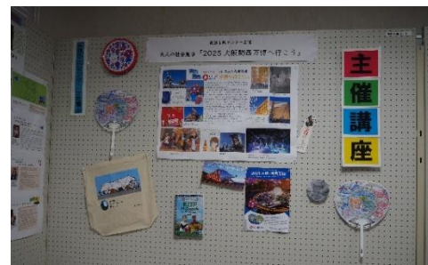
▲大人の社会見学「万博へ行こう」 展示を見ながら万博に行った時の ことを懐かしく思い出しました。