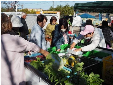
▲フレッシュな野菜満載の軽トラ市