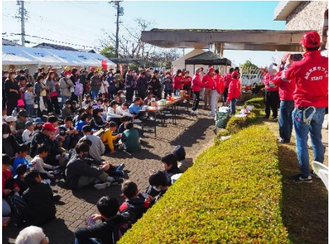
▲ピングゲーム大会は、カードが足りなくなるほどの人気でした。来年はたくさんのカードを用意しますね。