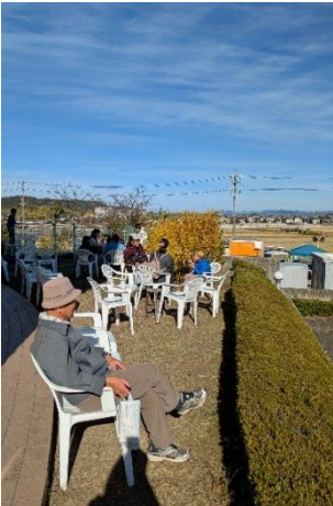
▲晴天で暖かく、カフェエリアは、大人気♡

恒例の「ピングゲーム」「シクラメン販売」「軽トラ市」に加え、今年も「美旗の飲食店大集合」と題して、美旗に店舗を構える飲食店さんに出店いただきました。下記参照 あん藤-ando-(うどん)・15種類のわたがし屋さん・魚忠・豊(明石焼き)・珈豆坂(挽きたてコーヒー)、生地たこや喜げんばベアークロー(串焼き)・KOReKOso CHICKEN naBARI(キムパ・韓国おでん)、すーさん家(うなぎ弁当)・cafe sanaburi(パン・カフェ弁当)・CAFE&GALLERY ほっぷ&パン工房あうる(パン)ちょっくら(唐揚げ)・Buonappetito!YOMOYAMAくん(牛筋カレー他)・フルル(シフォンケーキ)まるきゅう(大判焼き) また軽トラ市では、キウイ、フレッシュなトマト、お餅、新田ミカン、伊賀米、黒ニンニク、野菜に加え、葉牡丹や野菜販売や焼き芋もあり賑わいました。