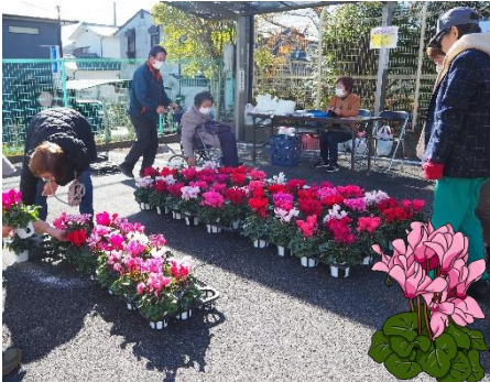
▲毎年、好評のシクラメン販売 今年は、お昼で完売御礼でした!!