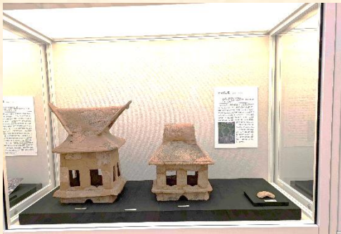
▲現在、Miemに展示されている女良塚から出土した家形埴輪(当センターから貸し出し中)

※現在、三重県総合博物館 Miem において、第41回企画展「発掘された日本列島」が12月14日(日)まで開催されており、その地域展示として、「王権東へ伊賀の古墳時代」というテーマで、伊賀地域から出土した埴輪や甲冑等も展示されています。当センターの家型埴輪も展示されていますので、皆さん、是非、足を運ばれてはいかがでしょうか？