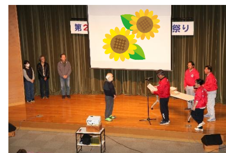
▲フォトコンテスト表彰式