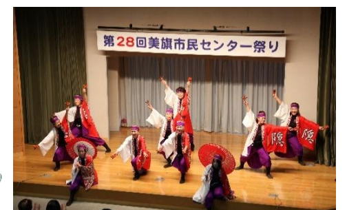
▲大トリはやっぱり Seyate 隠!!

美旗まちづくり協議会のInstagramにて 美旗市民センター祭りの様子を 写真や動画でご覧いただけます。 フォローよろしくお願いします。