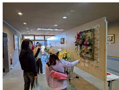
▲壁に掛けられたフラワー アレンジメント＜美華＞