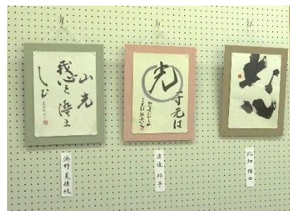
▲力強い皆さんの作品 ＜高齢者サロンの書道展示＞