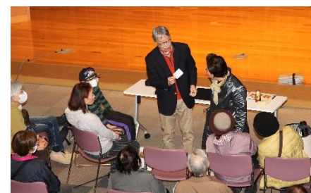
▲トランプの数字を当てるマジックに 皆さんびっくり!<のだの親父>

11月23日(祝・日)、発表の部を多目的ホールにて開催しました。どのサークルのかたも、日頃の練習や活動の成果を思う存分舞台の上で、披露していただきました。今年は脳トレやマジックサークルの体験型発表があり、観客を巻き込んで楽しく開催されました。