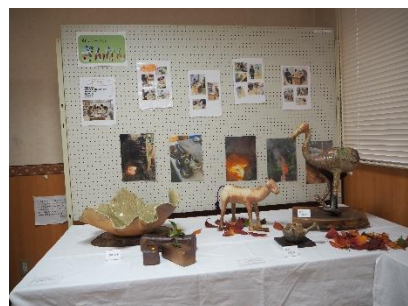
▲陶芸の焼成方法と作品 ＜ぎんなん＞