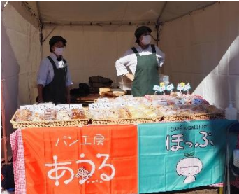
▲ほっぷ・あうるのやわらかいパンに癒されます🍞