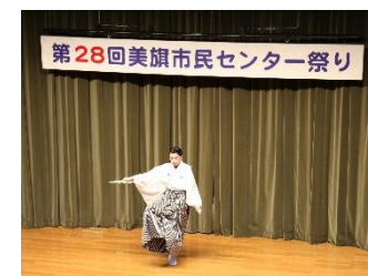
▲国宝!? 級の舞踊! (歌舞伎踊りの会)