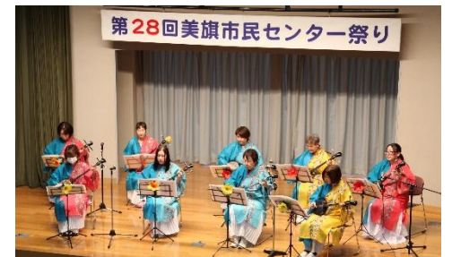
▲綺麗な衣装での三線演奏で、ホール には沖縄の風が吹きました♪ ＜ちゅらちゅら＞