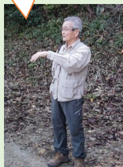
▲説明される松鹿講師