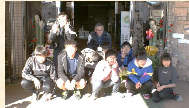
▲中学部2年生の皆さんと一緒に記念撮影