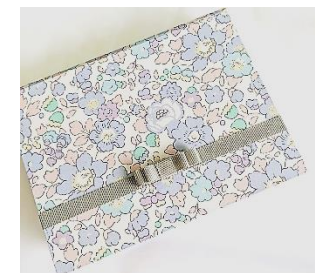
▲今回作るジュエリーボックス