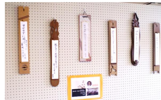
▲指を折り折り俳句を作りました

刺繍やソーイングの素敵な作品がずらりと並んでいます。また、今年度立ち上がった主催サークルの情報も満載です。