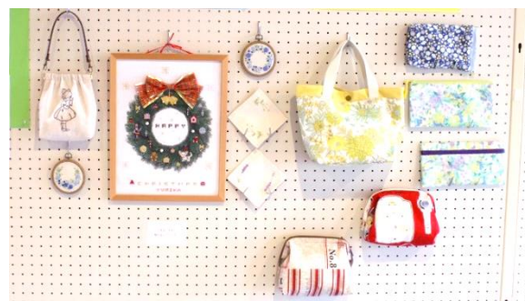
▲主催サークルで作った手作り作品

2階ロビー：美墨会（書道）・絵手紙サークル「四季」・七転八起（短歌）・陶美・釉の会（陶芸） 主催サークル（刺繍・ソーイング・俳句・筋トレ・脳トレ・三線） 主催事業（美旗市民大学講座・まなび体験セミナー・美旗高齢者学級）