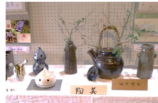
▲陶芸作品にはお花も生けて