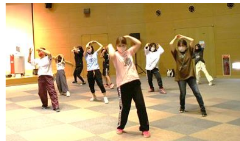
▲ポーズも決まっています!!

今回は、小学生から大人まで幅広い世代のかたにご参加いただき、1時間30分で、ダイナマイトのサビの部分だけでも踊れることを目標に、いざスタート!!最初は、思うよ