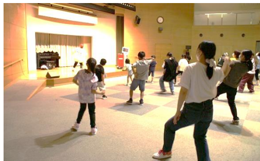
▲子どもたちも沢山参加してくれました。

「皆さんがこんなに踊れるようになるとは思っていませんでした。」と講師もびっくりするくらい、子どもから大人までしっかり踊れて楽しめた講座となりました。