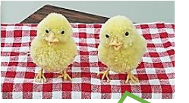
ひよこに見えるびよ!!