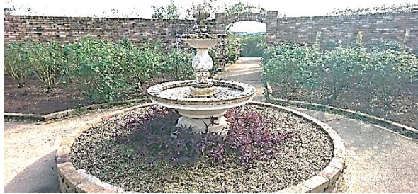
▲レッドヒルヒューサーの森 バラの庭園

ままだ。と思いながら見学しました。レッドヒルヒューサーの森では、睡蓮の池や木漏れ日の庭など散策し、ランチには食べられる花がいっぱいの「花のプレート」をいただき、心身共にリフレッシュできました。