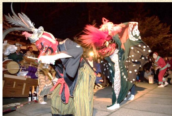
▲躍動感あふれる獅子舞