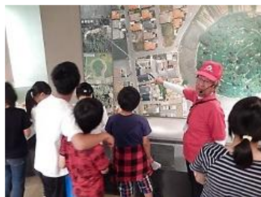
▲語り部さんの説明を熱心に聞く 桔梗東小6年生の皆さん

今年度の「美旗市民大学講座」も、この「なばり学」をもとに「大人のなばり学」というテーマで開催します。皆さんもこの機会にぜひご来館ください。