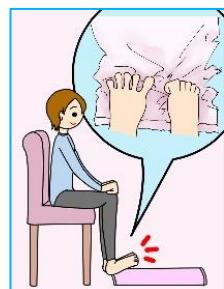
足の指でタオルを引き寄せる運動