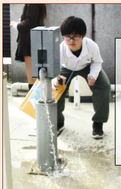
手押しポンプ体験