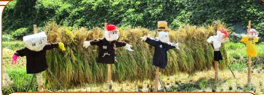
「はさがけ」と5年生製作「かかし」

5月7日に植えた苗が7月3日には稲の根元から新しい茎が出て成長しています。その後、8月25日位に「水抜き」をして、稲の成長を完了させ、収穫作業をスムーズにします。