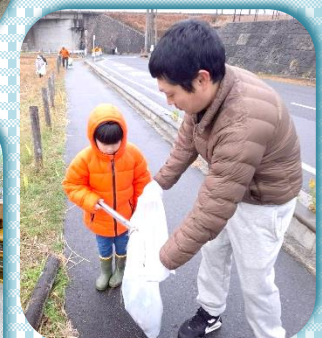
子どももお手伝い