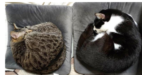
井上さん宅で安心して暮らすはまとまつ