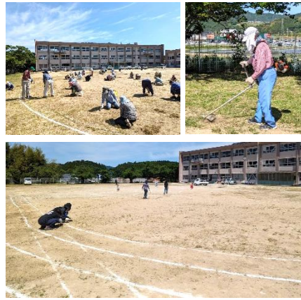
草引きで一部綺麗になった小学校運動場

4月21日(日)、5月25日(土)と、蔵持小学校 PTA と地域ボランティア、寿会が協力して、運動会前のグラウンドの草刈り・草引きをしました。蔵持小学校のグラウンドには思った以上に草が生え、暑さもあり作業は難航しましたが、皆さん「子ども達が思いっきり体育大会を楽しめるように」と一生懸命作業をして下さっていました。子ども達が走るコースの上には、雑草が少し残ってしまいましたが、子ども達は当日地域の皆さんの想いを受けて、体育大会を楽しんで欲しいです