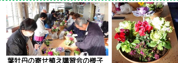
葉牡丹の寄せ植え講習会の様子

※「味噌づくり教室」は参加希望者多数のため抽選となります。1月15日前後に申込者全員に連絡予定です。