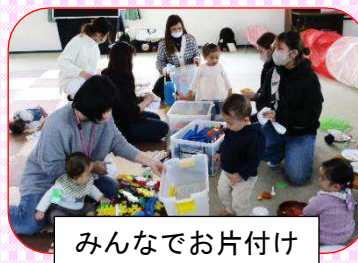
みんなでお片付け