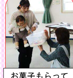
お菓子もらって 帰ってね