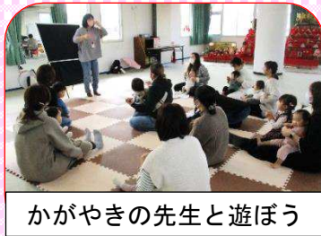
かがやきの先生と遊ぼう