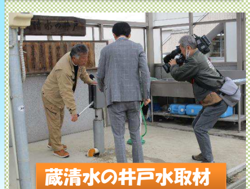
蔵清水の井戸水取材

料金は、1回・20L・50円、年間・使い放題・2,000円です。※災害時は無料です！