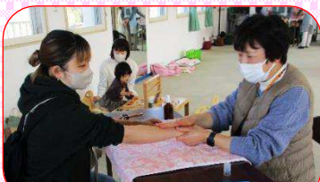
2月は「ハンドマッサージ」で 癒されました