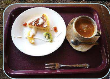
山添村にある「ブックカフェ ひろせ」で、チーズケーキと コーヒーをいただきました。