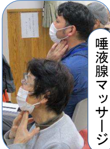
唾液腺マッサージ