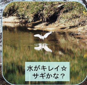
水がキレイ☆ サギかな?

今回は5月18日(土)開催予定です。今までは12月に開催していましたが初めて春の野鳥を観察します。場所は五主海岸(松坂市)です。詳しくは回覧板をご覧ください。