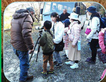
こどもさんもたくさん参加 してくれました☆