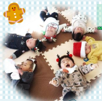
赤ちゃんの輪！ (実は全員男の子)