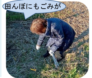
田んぼにもごみが