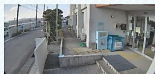
①のカメラのデモ映像