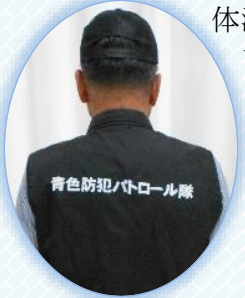
青色防犯パトロール隊

青色防犯パトロールの制服が新しくなりました。以前は長袖だったため夏場暑かったのですが、今回はベストになり、体温調節が楽になりました。