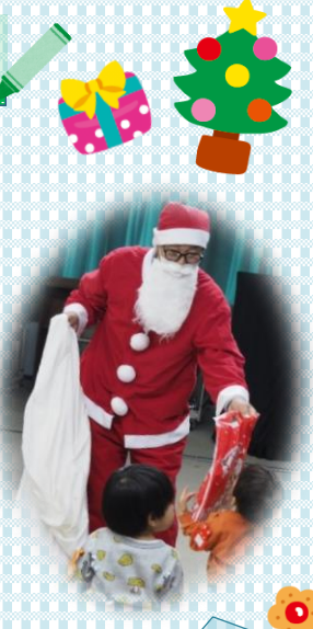
眼鏡をかけた サンタさん登場！