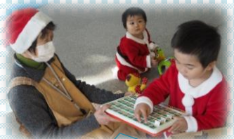
サンタさん姿が かわいい！