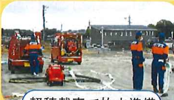
軽積載車で放水準備