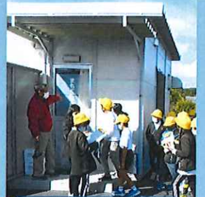
防災食製造のまもくら工房見学