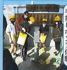
蔵持清水の井戸の手押しポンプ体験