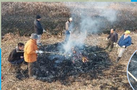
削った竹にお餅を刺して焼きます♪