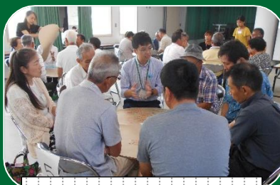
メンバーを変えて討議