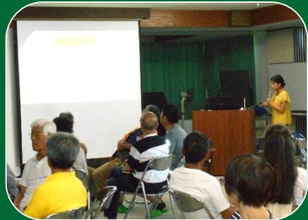
ワールドカフェの説明から 始まりました

夢があふれる“すてきな提案”がいっぱい出され、とても楽しく明るくなれたワールドカフェでした！