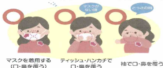
マスクを着用する (口・鼻を覆う)

くしゃみや咳が出る時には、飛沫にウイルスを含んでいるかもしれません。咳エチケットを心がけましょう。