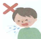
何もせずに 咳やくしゃみをする