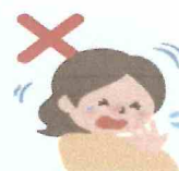
咳やくしゃみを 手でかさえる