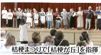
桔梗まつりで「桔梗が丘」を指揮

南市民センターサークル活動「リフレッシュ体操」は30年以上継続、ウォーキングも日課です。