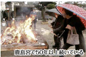
鹿島宮で50年以上続いている