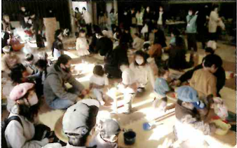
住民交流部会の「世界のおもちゃ桔'ず広場」

新春1月7日(日)、ハッピーニューイヤー・ききょうフェスタに150人が参加。子どもたちは保護者、ボランティアらと世界のおもちゃ遊びやゲーム等をいっぱい楽しんだ後、お菓子の福袋や赤飯をもらって、お正月を楽しんでいました。