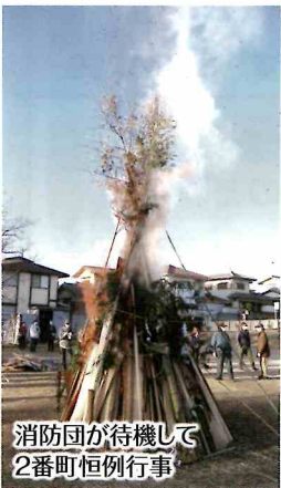
消防団が待機して2番町恒例行事