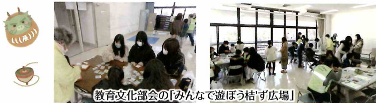
教育文化部会の「みんなで遊ぼう桔'ず広場」