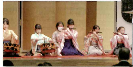
駐車場の衛星アンテナ

2月5日(日)、桔梗が丘市民センターで開催された「第36回新春謡曲仕舞大会」の様子が衛星中継で全国にLIVE配信されました。舞台上で日頃の練習の成果が披露され、厳かな雰囲気にも包まれました。