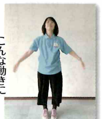
こんな動きになつていませんか?