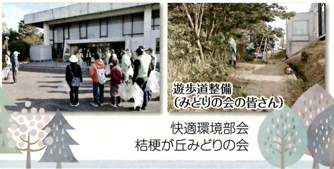
遊歩道整備 (みどりの会の皆さん)

クリーン活動の後、みどりの会の人たちは、公園内の遊歩道の樹木の伐採や「ポイ捨て禁止」看板の整備をしてくれました。