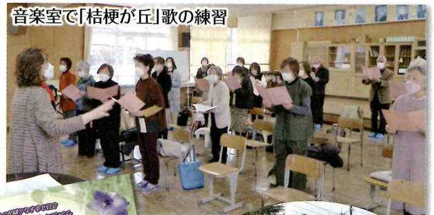
音楽室で「桔梗が丘」歌の練習

協議会から、地域との繋がりの一助として「クリアファイル(公園の四季)」と「ロゴシール」を卒業生全員にプレゼントされました。