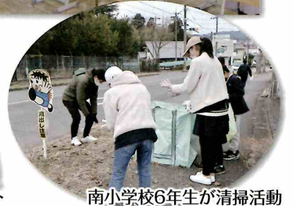
南小学校6年生が清掃活動