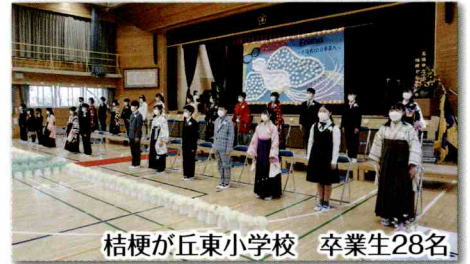
桔梗が丘東小学校 卒業生28名