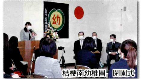
桔梗南幼稚園 閉園式