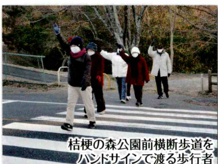
桔梗の森公園前横断歩道を ハンドサインで渡る歩行者