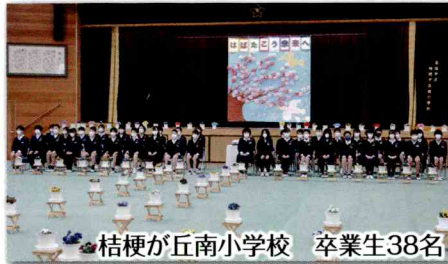
桔梗が丘南小学校 卒業生38名