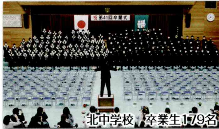
北中学校 卒業生179名