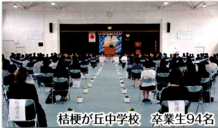
桔梗が丘中学校 卒業生94名

今年もコロナの影響で自粛ムードのなか、卒業シーズンを迎え、3月11日(金)に桔梗が丘及び北中学校の卒業式、17日(木)桔梗南幼稚園の卒園式と閉園式、18日(金)には、桔梗が丘3小学校の卒業式が行われました。卒園・卒業生の皆さん、新しい環境のもとで友だちをたくさんつくり、元の日常生活を一日も早く取り戻し、元気で楽しく過ごせるよう願っています。