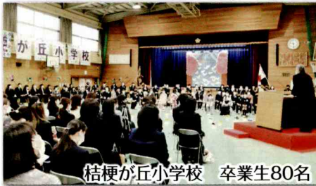
桔梗が丘小学校 卒業生80名