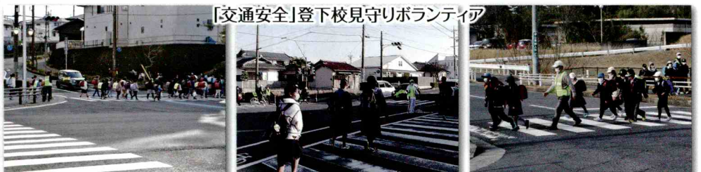
「交通安全」登下校見守りボランティア