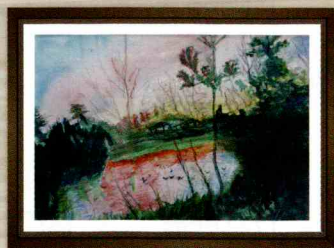
「桔梗の森 東屋の朝焼け」