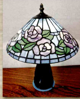
スタンドグラス「ランプシェード」