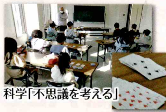
科学「不思議を考える」