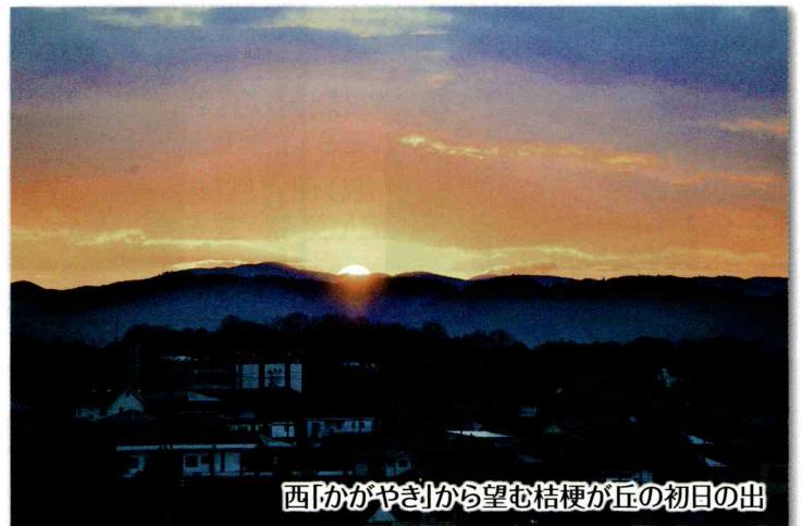
西脇がやきから望む桔梗が丘の初日の出