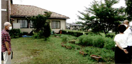
広場の芋ほりにはききょう農楽園がお手伝い