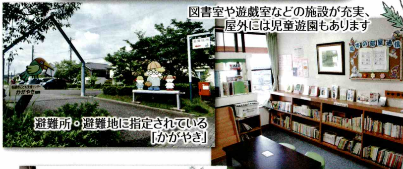
図書室や遊戯室などの施設が充実、屋外には児童遊園もあります