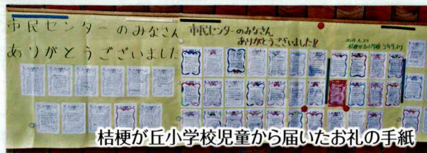
桔梗が丘小学校児童から届いたお礼の手紙