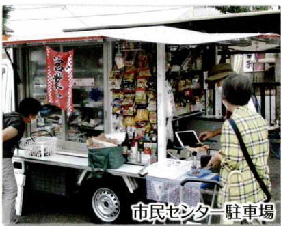
市民センター駐車場

また、移動販売事業者は名張市との「地域の見守り活動に関する協定」により、まちの保健室と連携して住民の見守りをしていくていきます。 かつての様な駅前の賑わいを待ち望んでいる住民の願いと共に、買物が不自由な住民への施策は、＼ほつとまち＼桔梗が丘のこれからの課題です。