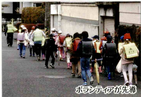
ボランティアが先導