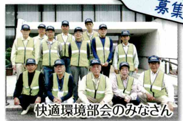
快適環境部会のみなさん