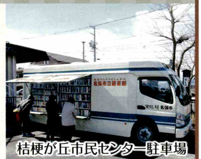
桔梗が丘市民センター駐車場

巡回曜日、時間などは広報なびり2-2号に掲載されています。図書館TEL:63-3260