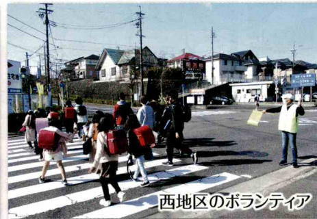
西地区のボランティア