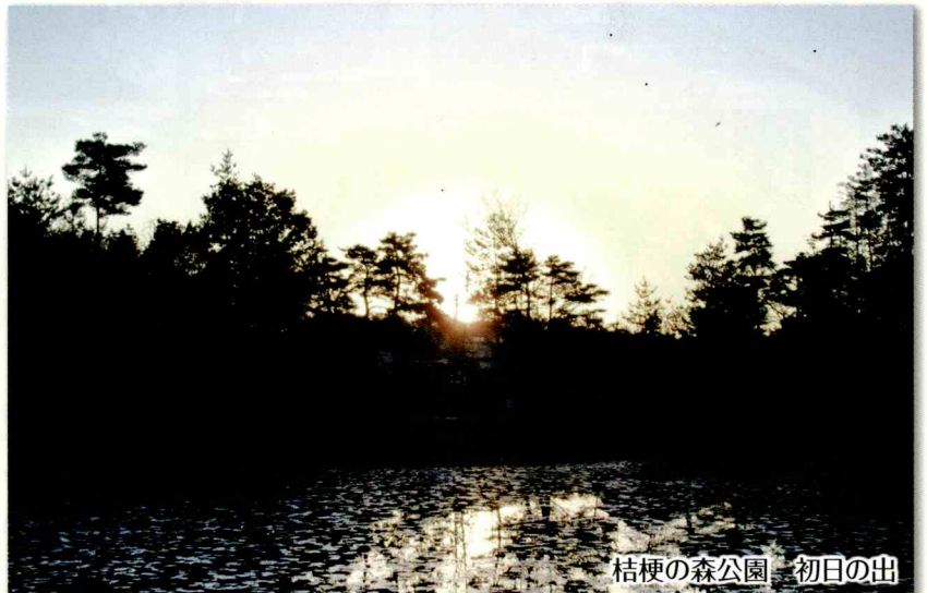
桔梗の森公園 初日の出