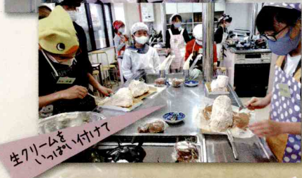
生クリームを いっぱい入れた