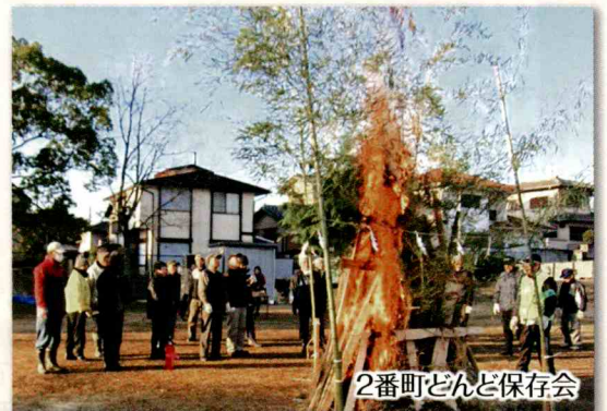
2番町どんど保存会