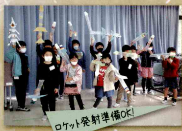
ロケット発射準備OK!