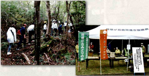
東山ふれあいの森公園で自然体験学習会

子どもたちと地域の絆づくり事業として、毎年秋に3小学校児童と東山ふれあいの森公園で自然体験学習を実施しています。今回は、桔梗が丘南小学校の児童と交流を深めました。