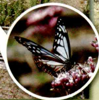
グリーンボランティア三重の皆さん