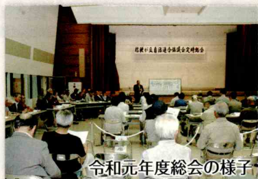
令和元年度総会の様子

コロナで協議会の定時総会が初の書面表決となりましたが、令和2年度の新体制がスタートしました。自治連合会（区長・自治会長）のみなさま共々よろしくお祈りします。