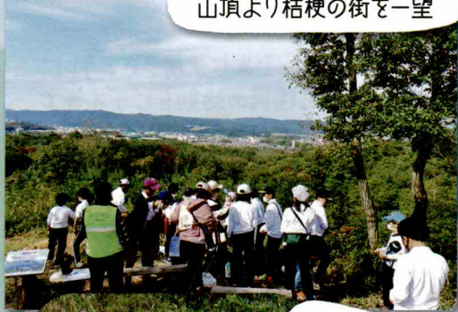
山頂より桔梗の街を一望