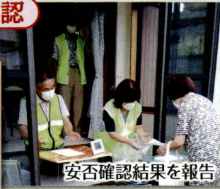
安否確認結果を報告