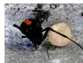
セアカゴケグモと卵のう

桔梗が丘全域にセアカゴケグモの営巣地が見つかりました。9月末から1か月間分布調査を行い、37か所で確認しました。このクモを見つけた場合は、毒性があるので素手で触らないようにしてください。