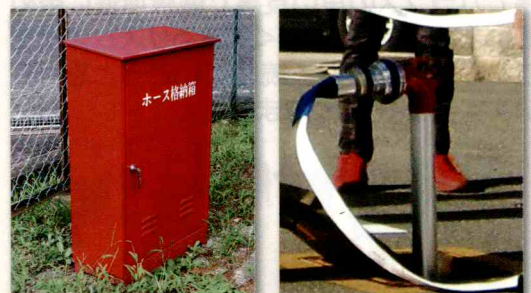
消火栓ホース格納箱 全地域に設置完了

児童公園（地域内23か所）に計画していた消火栓ホース格納庫が本年度で設置完了しました。火災発生時の初期活動として消防団や自主防災隊が素早く対応できるようになりました。