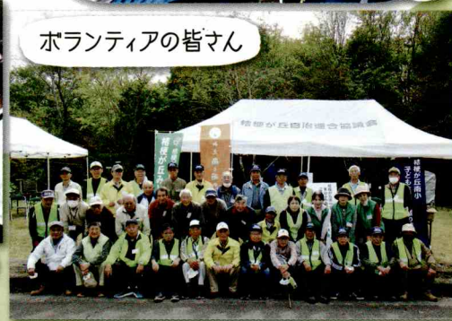
ボランティアの皆さん