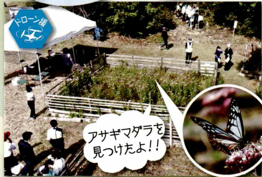
アサギマダラを見つけたよ!!