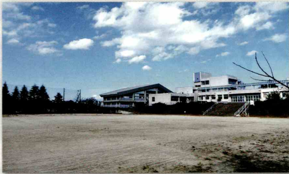
桔梗が丘中学校跡地利活用は越年

跡地利活用は地域住民にとって一大関心事であり、一刻も早く決めてもらいたいです。現時点では、見通しは立っていません。