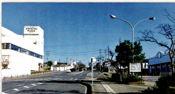
桔梗が丘駅前の衰退

大型店舗が撤退し、近鉄プラザも閉館して駅前が一層寂しくなりました。住民の皆さんは勿論のこと協議会としても早く賑わいを取り戻したいと行政、近鉄にお願いし、交渉を続けています。