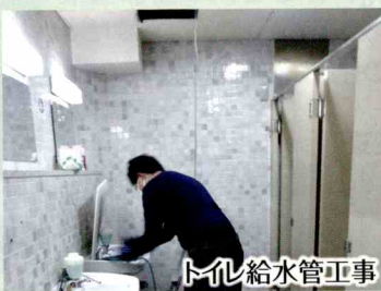
トイレ給水管工事