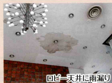
ロビー天井に雨漏り