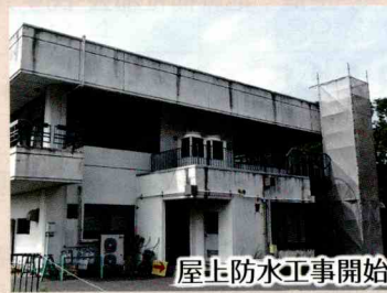
屋上防水工事開始