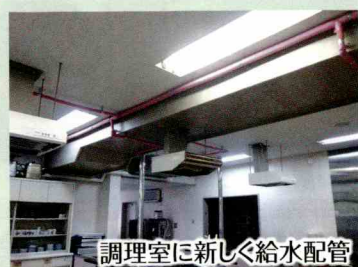
調理室に新しく給水配管