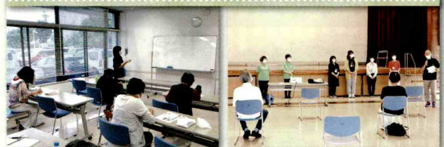
セミナー、サロンで講師、市民センター等で健康体操をサポート

桔梗が丘まちの保健室では、コロナ感染予防により外出を控え、活動を抑制された住民のため、新しい生活様式を探りながら地域と一体となってコロナと共存した活動をしています。また、よくばり青春体操、健康セミナー等住民自らの健康づくりを支援しています。