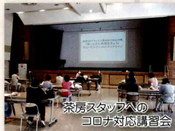
茶房スタッフへのコロナ対応講習会