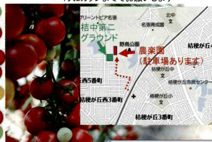
ききょう農楽園 (桔梗が丘自治連合協議会)

体験費用：100円/ワンカップ詰め放題(約20個程度) 1人2カップまででお願いします