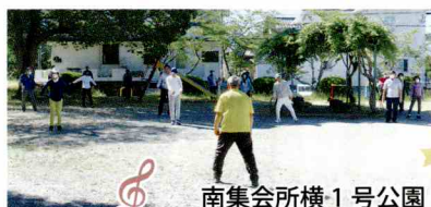
南集会所横1号公園