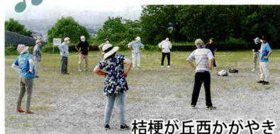
桔梗が丘西かがやき