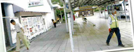
マナーアップ“ほっとまち”

5月18日は1番町区、6月10日は第1ブロック(1番町区、3番町区)と、ぎゅーとらの有志の皆さんで桔梗が丘駅前周辺の草刈り・清掃活動が行われました。 地域住民と民間企業の協同による社会貢献活動は、地域づくりには欠かせません。同様の取り組みは、各区で多く見受けられますので、今後紹介をしていきます。