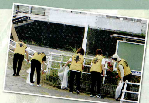
桔梗が丘の玄関口、桔梗が丘駅前の継続的な清掃奉仕活動ありがとう!