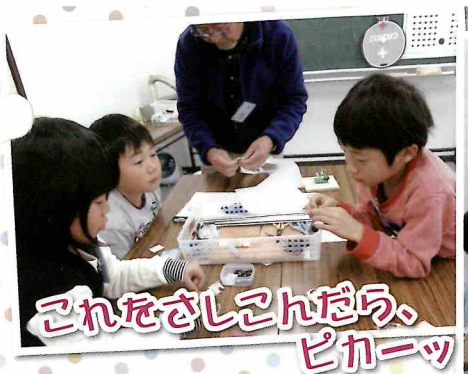
これをさしこんだら、ピカーッ