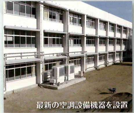
最新の空調設備機器を設置

の設置なども行うことになっています。 今後は2月末の完成後、現在の桔梗が丘中学校から物品や新たな備品の搬入など引越し作業を行うことになっています。 広々とした敷地、校舎や設備など整備された教育環境のもとで子どもたちに学業、部活動などに励んでもらいたいと願っています。