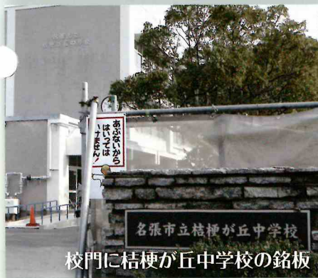
校門に桔梗が丘中学校の銘板

の設置なども行うことになっています。 今後は2月末の完成後、現在の桔梗が丘中学校から物品や新たな備品の搬入など引越し作業を行うことになっています。 広々とした敷地、校舎や設備など整備された教育環境のもとで子どもたちに学業、部活動などに励んでもらいたいと願っています。