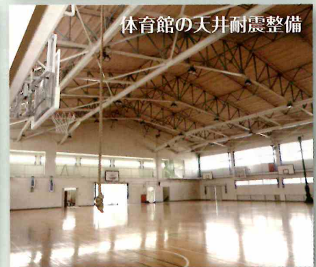
体育館の天井耐震整備