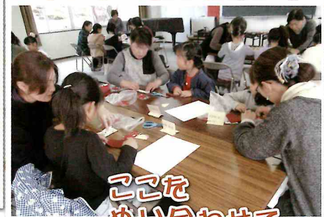
ここをぬい合わせて...