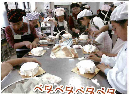
ペタペタペタペタおいしそう