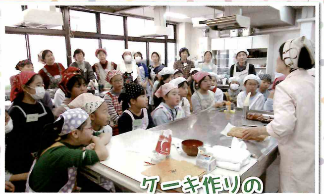
ケーキ作りのいちばんのコツは...

「料理」「手芸」「科学」の3講座に合計58名の児童が参加し、クリスマスケーキ、ハート型オーナメント、光るクリスマス飾りに取り組みました。また、30名のボランティアの方に支援をいただきました。