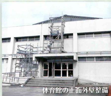
体育館の正面外壁整備