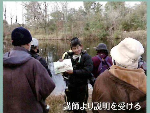
講師より説明を受ける