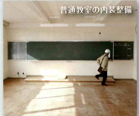
普通教室の内装整備

桔梗が丘中学校の移転改修工事が昨年10月から始まり、4月開校に向けて着々と進んでいます。 工事は主に校舎、体育館、格技場の改修です。校舎は、外壁の塗装、水漏れ対策、トイレの洋式化などです。体育館・格技場は、地震対策として天井の安全対策を行っています。また、照明器具のLEDへの取り替え、教室への空調設備