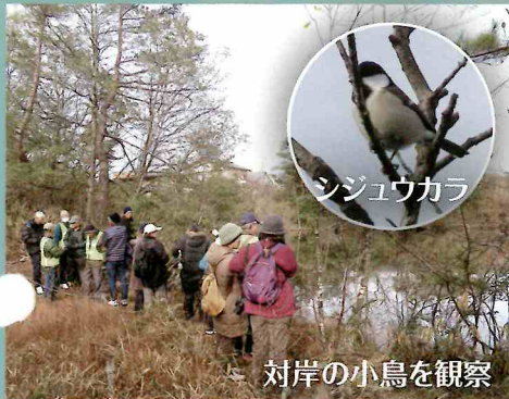
対岸の小鳥を観察