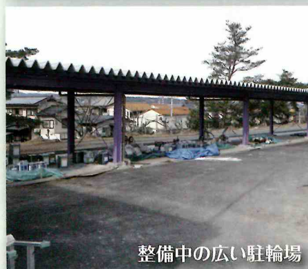
整備中の広い駐輪場