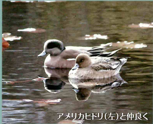
アメリカヒドリ(左)と仲良く

11月11日(土) 毎年恒例のバードウォッチングを開催しました。 当日は穏やかな天候に恵まれ、参加者20名で、日本野鳥の会の講師のもとに、桔梗の森公園及び徳明池(西・東)地域を散策しました。 図鑑を用いた説明やフィールドスコップで小鳥の近接姿に触れ特に池に浮かぶカモなどに給餌したり、20種に及ぶ小鳥に出会い身近に生態を観察することができました。 このように多くの鳥が来る素晴らしい環境をいつまでも護つていきましょう。