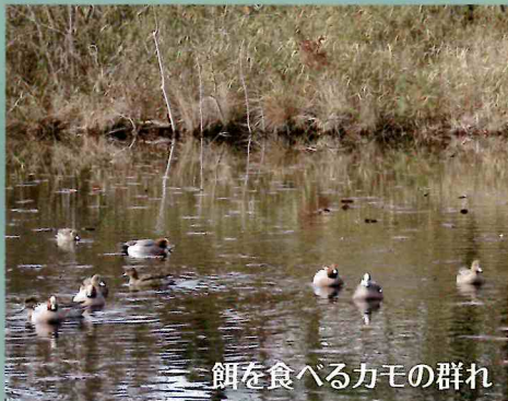
餌を食べるカモの群れ