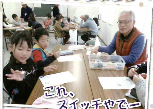
これ、スイッチャーでー