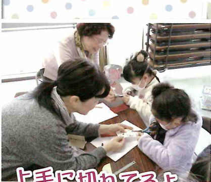
上手に切れてるよ