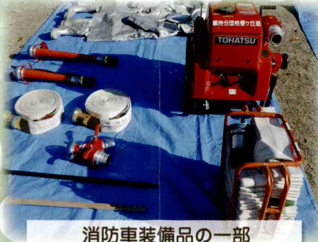
消防車装備品の一部