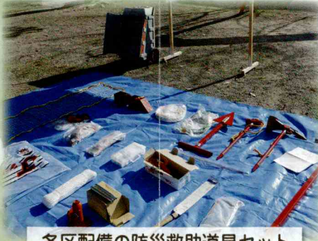
各区配備の防災救助道具セット