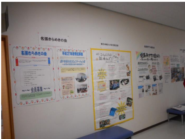
↑ ネットワーク会議による パネル展示の様子